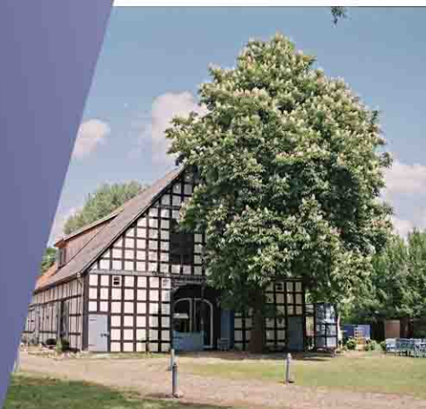
21. Jahrh. ab 2000

1999 war es möglich, den Hof zu erwerben und unter den Auflagen des Denkmalschutzes zu sanieren. Ein Bauumfang, der den Hof in eine neue, lange tragende Nutzung führen sollte. Neben den Anforderungen des Denkmals sollten vor allem die Anforderungen an energiesparende Gebäude erfüllt werden.